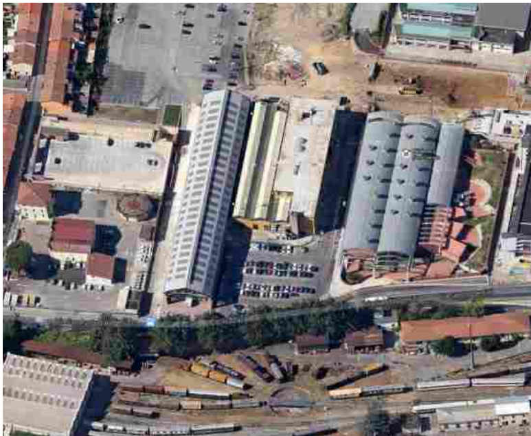
Un'immagine dall'alto del complesso immobiliare della Fondazione nell'area ex Breda

PISTOIA. La Fondazione Cassa di Risparmio di Pistoia e Pescia ha pubblicato