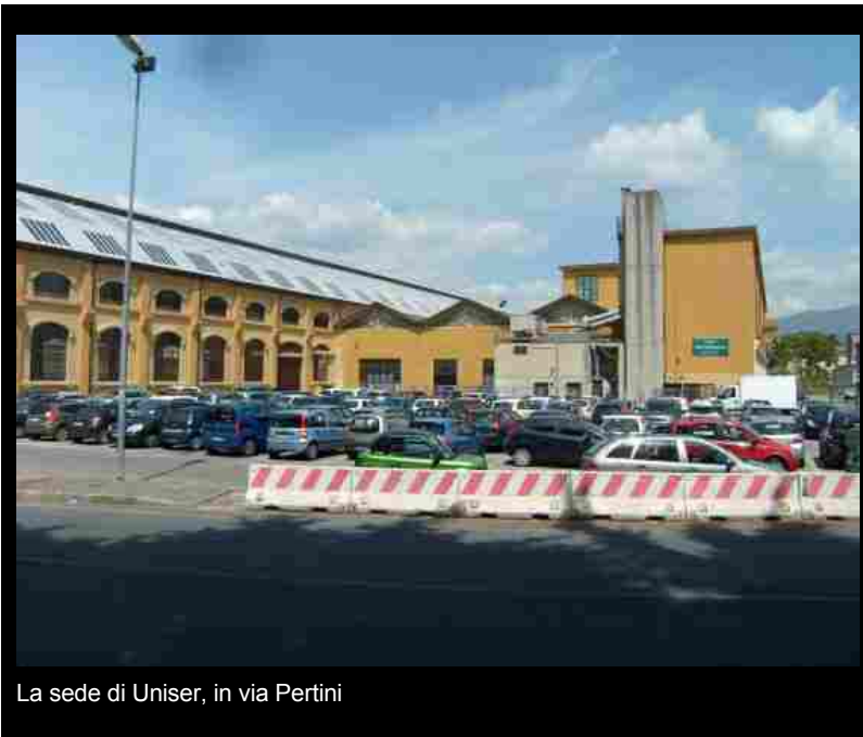
La sede di Uniser, in via Pertini

I progettisti dovranno perciò proporre soluzioni per la riqualificazione estetica dei prospetti del fabbricato (in particolare di quello meridionale che si affaccia su via Pertini) e per il miglioramento funzionale dell'accesso al Polo universitario di Uniser, intervenendo quindi anche sulle aree pubbliche adiacenti, fra cui l'area attualmente adibita a parcheggio. Particolare attenzione dovrà essere rivolta al perfezionamento delle relazioni tra i diversi fabbricati, valorizzando le connessioni tra le funzioni pubbliche presenti - biblioteca, università, spazi espositivi, locali per convegni - e quelle di prossimo inserimento, quale il museo dei rotabili storici che sarà realizzato nella vicina area ferroviaria sul lato sud di via Pertini.