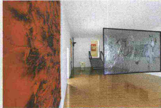
Particolare Sala IX / detail Room IX, Palazzo Albizzini, Città di Castello - Perugia