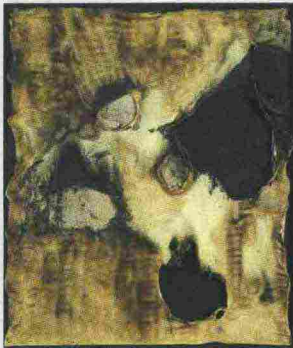
«Combustione Plastica», 1958, plastica, stoffa, acrilico, vinavil, combustione su tela / plastic, fabric, acrylic, Vinavil, combustion on canvas, 98x84 cm