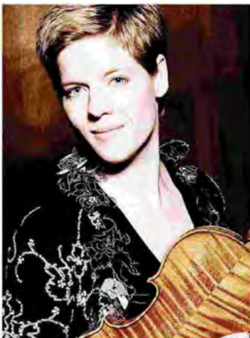
La violinista Isabelle Faust