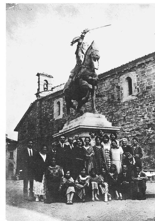
A fianco: il monumento a Ferrucci in un'immagine degli anni '30. In basso: veduta di Uzzano.

Con Francesco Ferrucci da Calamecca a Gavinana si ricostruisce un affresco della leggenda ferrucciana (Francesco Ferrucci eroe del 1530 che trovò la morte nel castello di Gavinana nell'estremo tentativo di difendere la Repubblica di Firenze) che contribuisce a rappresentare e descrivere aspetti fondamentali della memoria collettiva di queste zone.